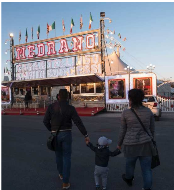
Due spettacoli al giorno con clown, acrobati e trasformisti

LUCCA. Non è il loro solito show, ma sono comunque operativi e pronti a regalare sorrisi a famiglie e bambini. Nonostante il Tar gli abbia dato torto costringendoli a seguire la moratoria del Comune che vieta le esibizioni con animali, gli artisti del circo Medrano continuano a fare due spettacoli al giorno in piazzale Don Baroni a Lucca.