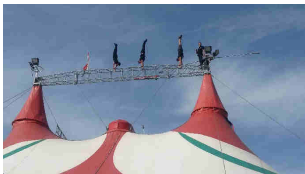
La Troupe Gerlings