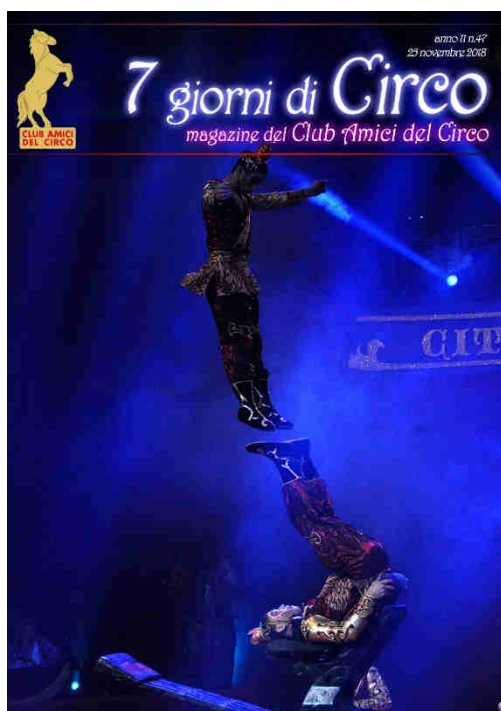
La Troupe della Scuola di Nanchino

Come ogni settimana è uscita 'Sette giorni di Circo' , la Newsletter del Club Amici del circo!