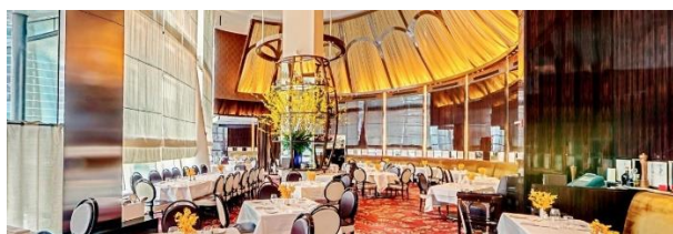
(una delle sale del ristorante "Le Cirque")