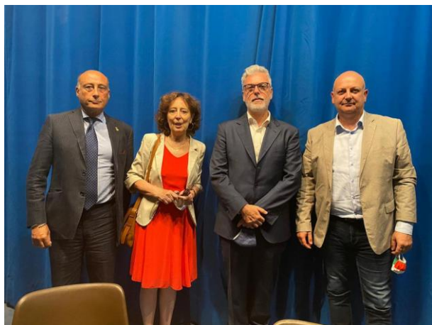
presidente Buccioni insieme alla Dr.ssa Donatella Ferrante, all'onorevole Federico Mollicone e Gianluca Cavedo

ricordando quanto sia importante inviare tutti i documenti richiesti per non rischiare la inammissibilità. E quanto sia altresì importante un rigore nella presentazione delle domande, che a volte non hanno i necessari contenuti progettuali. Ha anche comunicato come le anticipazioni FUS siano partite e precisato che la necessità di avere il citato documento DURC rientra fra i prerequisiti essenziali.