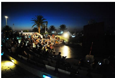
L'Arena del Porto Turistico Marina di Pescara per El Grito

esprimere un'energia capace di reggere anche il più grave dei contraccolpi. Questa volta il salto mortale si è dimostrato salto vitale.