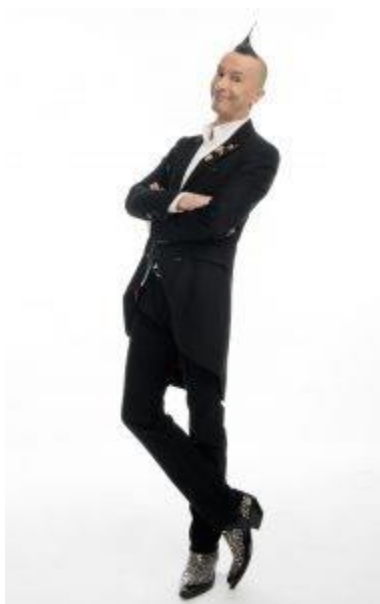
Arturo Brachetti

Il celebre trasformista è stato protagonista di Arturo racconta Brachetti , una “serata-sorpresa speciale” andata in scena il 25 luglio nella stupenda cornice del Teatro Monumento Gabriele D'Annunzio che per l'occasione ha registrato un tutto esaurito contingentato nel rispetto delle distanze di sicurezza (800 persone per spazi che normalmente ne ospiterebbero molte di più). È stato un incontro frizzante, orchestrato alla perfezione da De Ritis, nel quale Brachetti ha raccontato come solo lui sa fare la propria vita, tra l'intima confessione e il lazzo istrionico. Aiutato da video delle sue performance e da una serie di foto personali (tra le quali diverse dell'infanzia), l'artista ha delineato un viaggio sopra e sotto al palcoscenico, sempre all'insegna dell'immaginazione creativa, inseguendo i ricordi delle sue straordinarie avventure. Una storia incredibile che include, come recita il foglio di sala: “ Fregoli, Parigi e le luci della Tour Eiffel, Ugo Tognazzi, la macchina da cucire della mamma, il Paradis Latin, e le mille fantasie di un ragazzo che voleva diventare regista o papa ”.