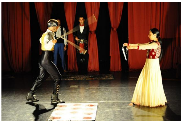
Malamat, il nuovo show della compagnia El Grito in prima assoluta per Funambolika

fatto di musiche, equilibrismi, numeri aerei e danze spericolate (ispirate da antichissimi costumi d'Oriente) che vogliono restituire agli spettatori il potere insito negli esseri umani in grado di scuotere la coscienza e risvegliare lo spirito assopito. Un tema perfettamente centrato rispetto alla nuova quotidianità che stiamo vivendo e che ci spinge a riflettere sul potenziale da sfruttare per ripartire. Lo spettacolo, in cartellone fino al 2 agosto, è cresciuto di sera in sera e tutto fa supporre che si tratterà di un altro grande successo per El Grito, che si conferma una delle compagnie più interessanti del nuovo circo italiano.