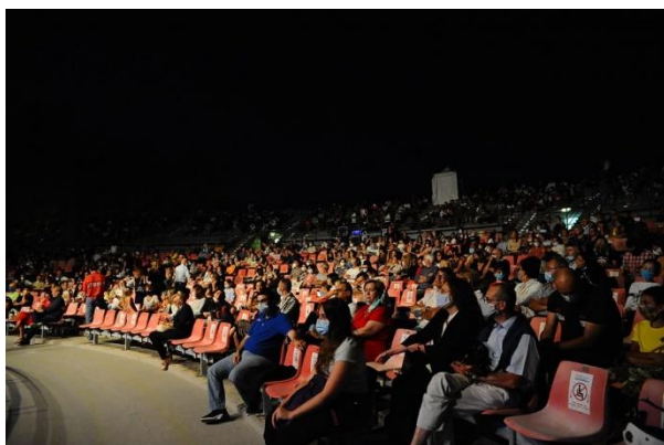
Il Teatro Monumento Gabriele D'Annunzio per Arturo Brachetti