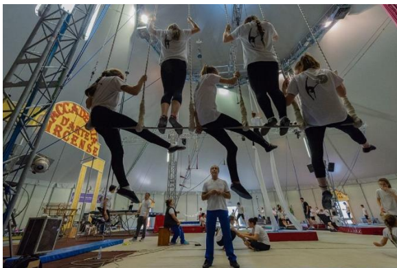
Al lavoro! L'Accademia riapre il 14 settembre

Uno dei settori maggiormente colpiti dall'emergenza coronavirus è quello dello spettacolo dal vivo; il mondo del circo in particolare si è trovato ad affrontare una situazione davvero complicata. Tournée interrotte per mesi, senza sapere se e quando sarebbero potute ripartire, compagnie bloccate in diverse città senza possibilità di far ritorno nei propri quartier generali, animali da sfamare... Questo stato problematico non ha colpito solo i tendoni: anche un'istituzione come l'Accademia d'Arte Circense ha dovuto fare i conti con una serie di difficoltà di difficile soluzione.