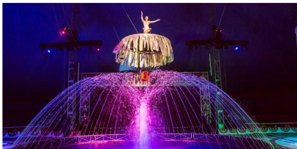
"Bellissimo" dell'American Circus