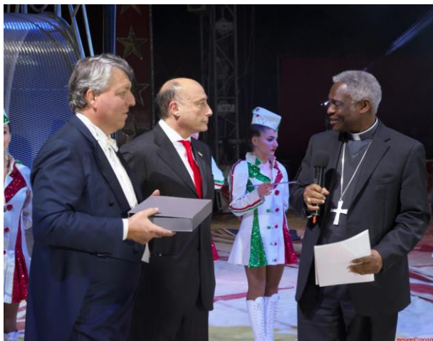
Il Cardinale Turkson intervenuto alla prima edizione del Premio mentre ritira il riconoscimento per Papa Francesco

hanno contribuito alla sua diffusione ed una sezione dedicata al Giovane Circo Italiano nella quale verranno premiati i migliori circensi tricolori del 2020. Viene dunque mantenuta la struttura della prima edizione,