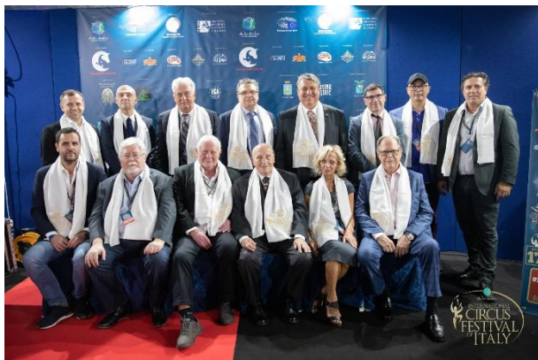
(la Giuria Tecnica 2019)

Solo artisti Italiani per l'edizione Covid Free del Festival e solo 80 posti a spettacolo