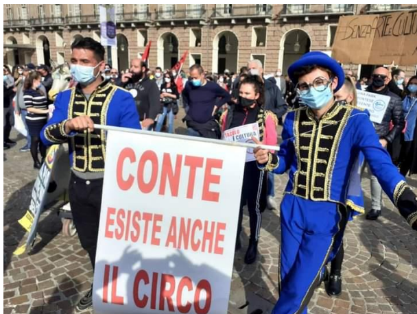
(Il Circo delle Stelle durante la manifestazione a Torino)

Sarebbe stato un modo per ringraziare chi durante la prima emergenza sanitaria non ha mai smesso di esserci, non ha mai chiesto nulla in cambio. Sarebbe stato uno spettacolo gratuito, per festeggiare tutti insieme il Natale.