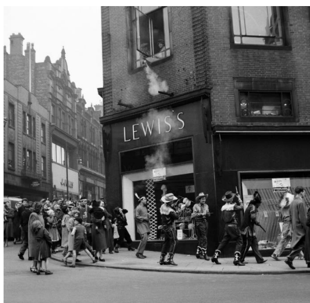
Cowboy e indiani di Billy Smarts Circus entrano in città e inscenano una rissa fuori da Lewis's ad Hanley. Davy Crocket Smart combatte l'attacco da una finestra al piano di sopra.