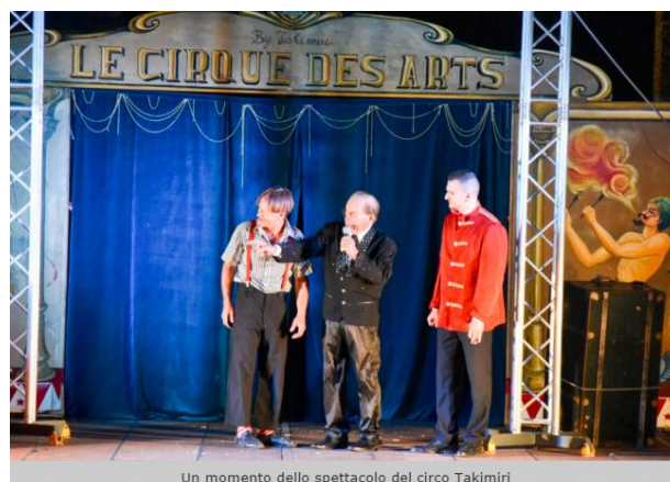
Un momento dello spettacolo del circo Takimiri