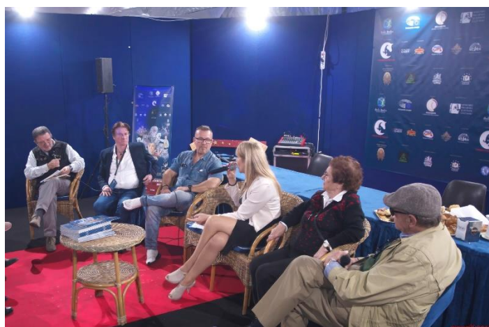
International Circus Festival of Italy, 22 nd edition Latina, dal 14 al 18 Ottobre 2021 www.festivalcircolatina.com #festivalcircoitalia