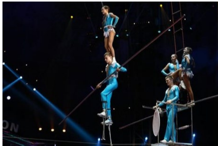
(La Troupe Kuznetzov.)

E' stata resa nota la composizione della Giuria del prossimo European Youth Circus di Wiesbaden.