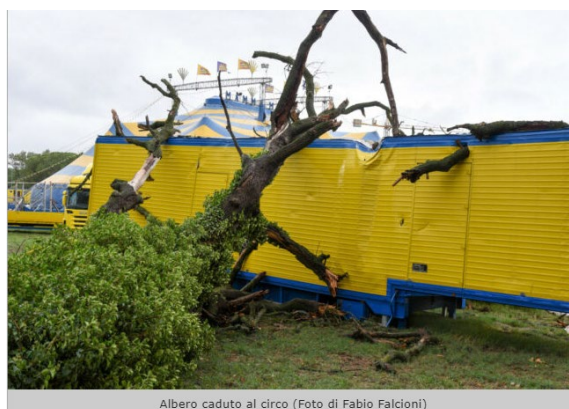
Albero caduto al circo

Fortunatamente non ci sono state gravi conseguenze, ma solo paura.