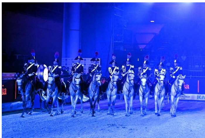
(il IV° Reggimento dei Carabinieri a cavallo)

Il "Galà d'Oro" è tornato nel suo massimo fulgore ad impreziosire la 124° edizione di "Fieracavalli" di Verona.