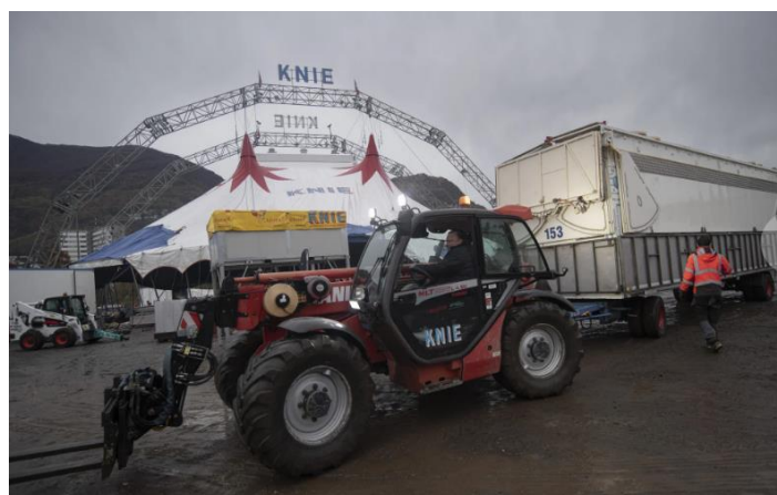
(Lo storico tendone del circo Knie)