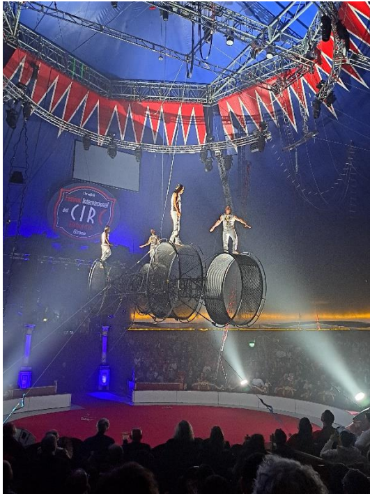
(The Flyers Valencia)