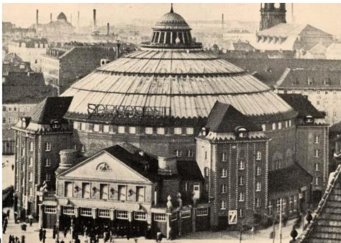
0 (L'edificio Sarrasani, eretto a Dresda nel 1912, era l'edificio circense più elegante e fastoso d'Europa)

ci si potrebbe trasferire negli uffici vicini. Un sogno sarebbe ovviamente di nuovo una casa permanente nel luogo di origine.