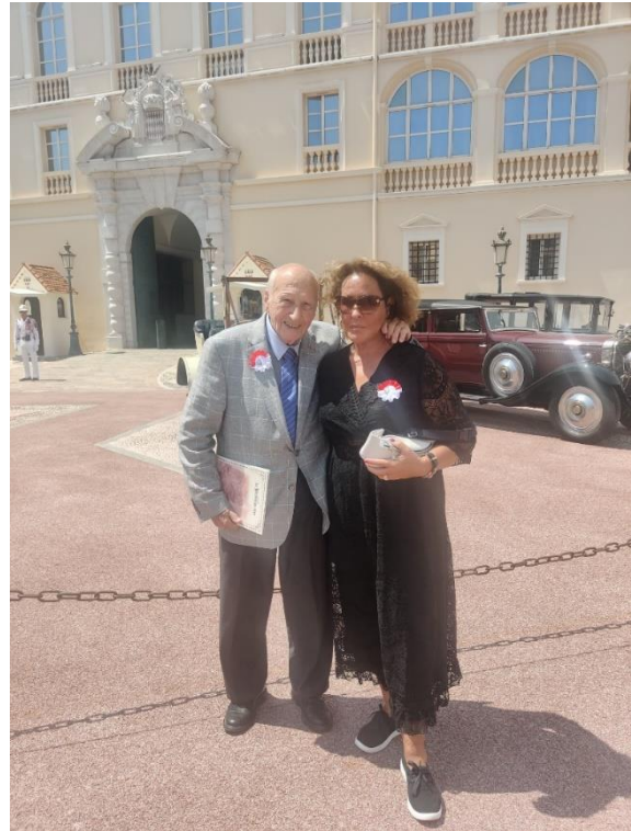
(con Cookies Varallo Baitillard)