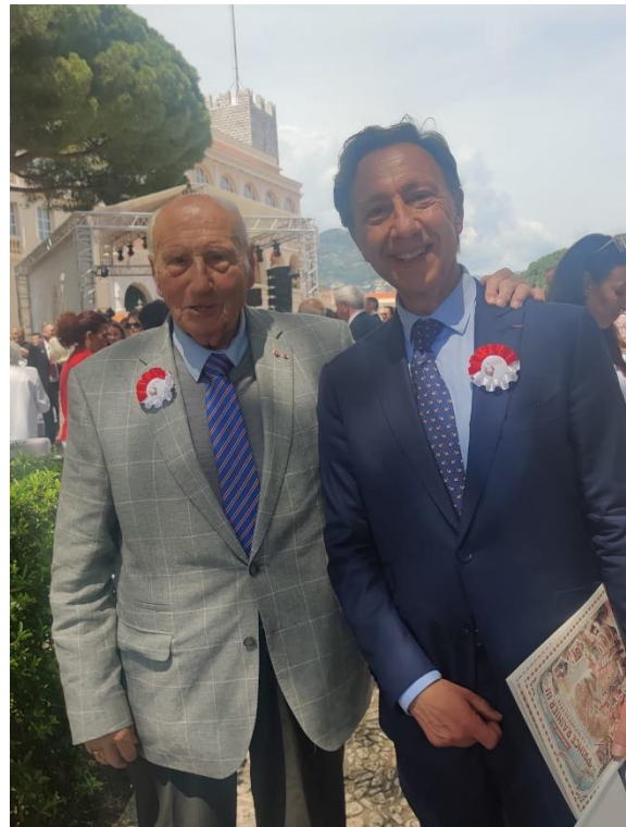
(con Stephane Bern)