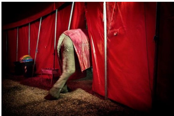
(Il mondo del circo raccontato da Daniela Vassallo)