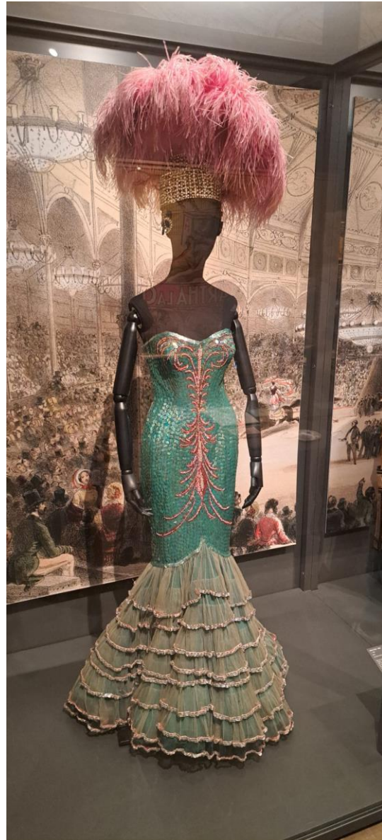
Un costume della grande Moira Orfei al Museo di Besalù

Parlavamo di ottimo livello dei numeri in gara, comunque, e su tutti ha svettato certamente la troupe di quindici trapezisti volanti Flying Gonzales dal Cile. Nella rutilante storia del circo è stata la terza volta che questa disciplina viene presentata con tre trapezi disposti in parallelo di fronte ad altrettanti porteur . Questa soluzione permette il dipanarsi degli esercizi senza pause con un effetto di grande spettacolarità; inoltre, nel repertorio della troupe il quadruplo salto mortale viene presentato con un grado di riuscita vicino al 100%. L'unico "Elefant d'Or" attribuito quest'anno dalla giuria – composta da ben cinque membri provenienti dal Sud America – è andato meritatamente a questa troupe formatasi appositamente per la partecipazione alla kermesse di Girona. I tre argenti assegnati hanno in comune la caratteristica di coniugare eccellenti qualità tecniche a una mise-en-scène indovinata e mai pesante: il duo " In Your hands " proveniente dal Circo Nikulin di Mosca ha dato vita ad un love affair al quadro aereo c.d. coreano, gli australiani del Replendance Duo ad un delizioso adagio acrobatico mentre la coppia canadese/moldava del Duo Soul si è cimentata in un sostenuto aereo al cerchio di grande impatto grazie ad una serie di sospensioni coi denti su un tappeto sonoro molto azzecato. Tra i bronzi segnaliamo soprattutto gli argentini del Duo Soma con una classicissima ed efficace performance alle pertiche.