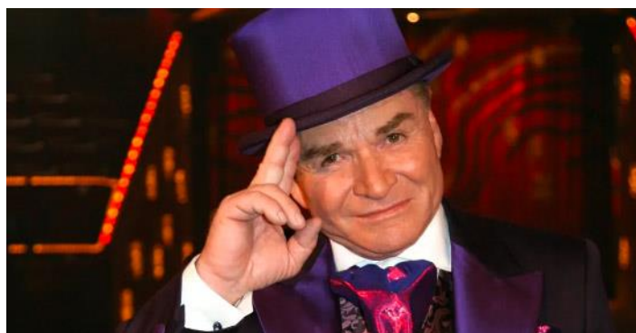
L'attore Fritz Wepper, il 4 dicembre 2008 al Circo Krone di Monaco, ha vestito i panni di direttore di circo per la registrazione della ARD "Stars in der Manege".