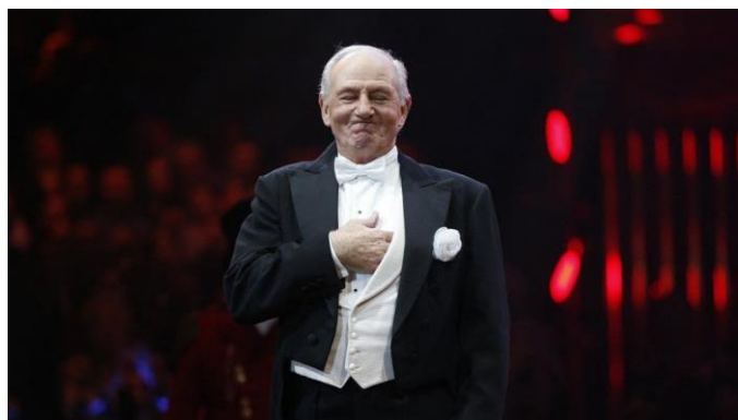
(Alexis Gruss è morto all'età di 79 anni)

Alexis Gruss è morto. Il re del circo equestre è morto all'età di 79 anni, lo ha annunciato sabato la sua famiglia in un comunicato stampa. Il patriarca dell'omonima azienda, le cui origini risalgono al 1868, è morto questa mattina all'ospedale Saint-Joseph di Parigi.